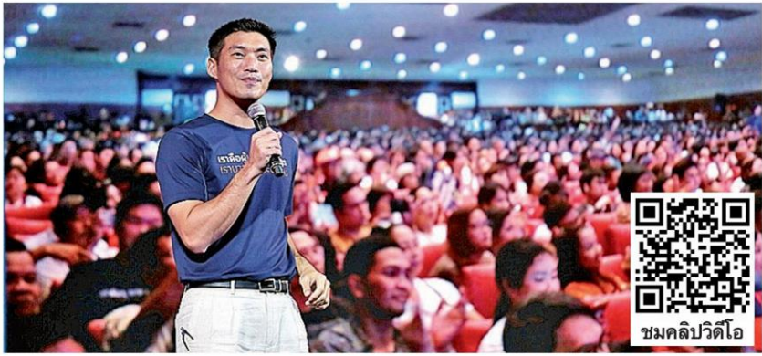
ครบรอบ 1 ปี - นายธนกร จิงรุ่งเรืองกิจ หัวหน้าพรรคอนาคตใหม่ (อนค.) แสดงวิสัยทัศน์ในงาน "1 ปี พรรคอนาคตใหม่ เดินไปด้วยกัน Walk with me Talk with me" โดยมีแกนนำ ส.ส.และสมาชิกพรรคเข้าร่วมกันอย่างคึกคัก ที่หอประชุมใหญ่มหาวิทยาลัยธรรมศาสตร์ ท่าพระจันทร์ เมื่อวันที่ 8 มิถุนายน